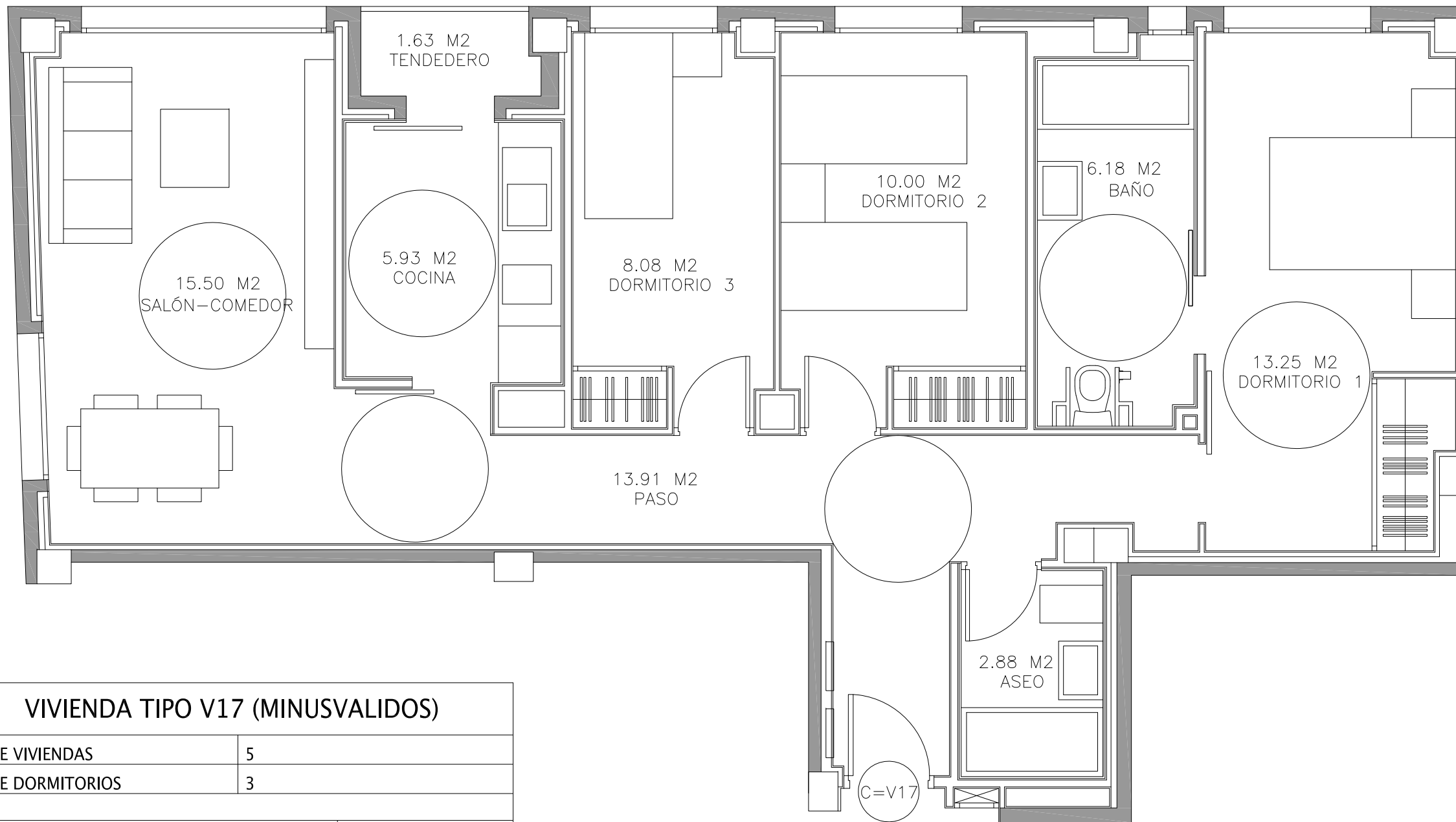
VIVIENDA TIPO V17